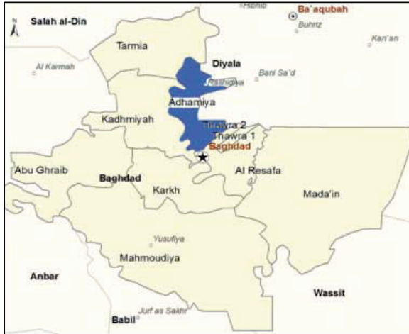
Bağdat Vilayeti'nde Türkmenlerin Yoğun Olarak Yaşadığı Yerler

Bağdat, 1534 yılında Kanuni Sultan Süleyman'ın Safevi hakimiyetine son vermesiyle birlikte, 1918'e kadar Türk hakimiyeti altında bulunmuş ve bu nedenle çok sayıda Türk Bağdat'a yerleşmiştir. 1918'den sonra da Irak devleti içerisinde görev almış çok sayıda Türkmen Bağdat'ı yurt edinmiş ve burada kalmıştır. Günümüzde Türkmenlerin daha çok Azamiye bölgesinde yaşadıkları bilinmektedir. Ancak Bağdat'ın hemen her bölgesinde yaşayan Türkmen ailesinin varlığından söz e-