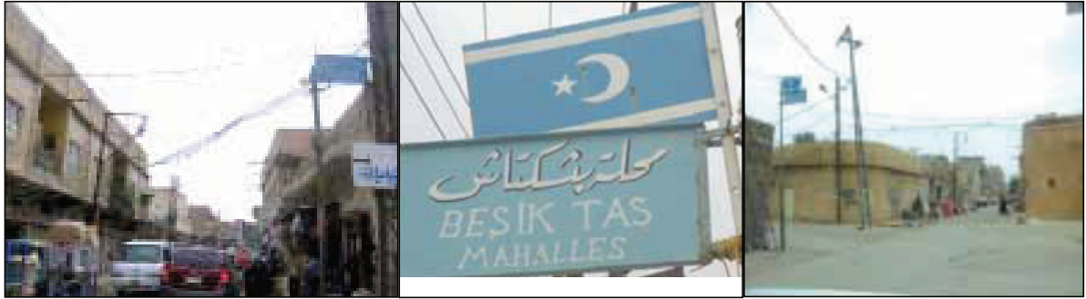
Kerkük'te Cırt Meydanı ve Beşiktaş Mahalleleri

Kerkük vilayeti, Kerkük Merkez İlçe, Dibis, Tavuk ve Havice olmak üzere 4 ilçeden oluşmaktadır. Kerkük "Irak'ın minyatürü" olarak anılmaktadır. Türkmenler Havice hariç diğer üç ilçede de yoğun olarak yaşamaktadır. Kerkük Vilayet nüfusunun yarısından çoğunun Kerkük Merkez İlçesinde yaşadığı söylenebilir. Daha sonra en kalabalık nüfus sırasıyla Tavuk ve Dibis'te yaşamaktadır. Türkmen nüfusun büyük çoğunluğunun Kerkük merkez ilçesinde ikamet ettiği bilinmektedir. Hassa Çayının ikiye böldüğü Kerkük merkez ilçesinde ise Türkmenlerin çoğu Tisin, Musalla, Korya, Bağdat Yolu, Sarıkahya, Şaturlu, Beyler, Piryadi, Almas, Arafa, Bulak, Çukur, İmam Abbas, Cırt Meydanı, Çay, 1 Haziran ve Beşiktaş Mahallelerinde yaşamaktadır. Türkmenler, diğer mahallelerde de dağınık olarak yerleşmiş durumdadır.