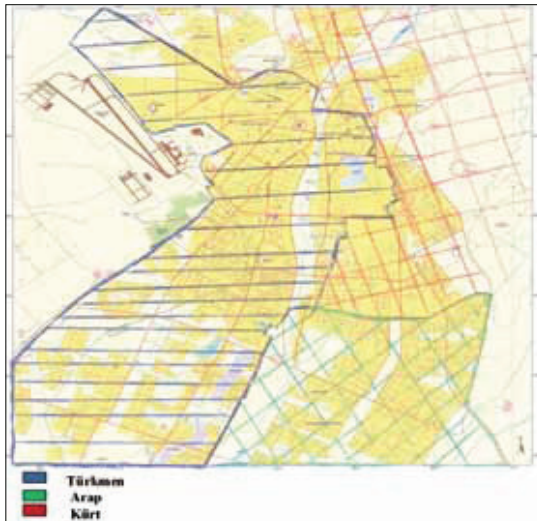
Harita-3: Kerkük Merkez İlçesi. (Bölümler etnik grupların çoğunluklarına göre ayrılmıştır)

Diğer taraftan Kerkük'ün tarım merkezleri olarak bilinen ve Tavuk ilçesinde Türkmen çoğunluğu görülmektedir. Ayrıca Kerkük'e bağlı Tazehurmatu nahiyesinin nüfus çoğunluğunu Türkmenler oluşturmaktadır. Tazehurmatu'nun merkezinin tamamına yakını Türkmendir. Ancak Tazehurmatu'ya bağlı Arap köyleri bulunmaktadır. Tavuk, Kürtlerin yerleşim politikaları sonucunda yarı yarıya konuma gelmiştir. Altınköprü'de Türkmen nüfusu azınlığa düşmüştür. Kerkük'ün etrafında ise Türkmenlerin yoğun olarak yaşadığı 10'a yakın köy vardır. Bu köyler, Türkalın, Yayçı, Çardaklı, Kızılyar, Kümbetler, Bulova, Beşir olarak gösterilebilir. Kerkük'te özellikle Şaturlu, Almas ve Arafa semtlerinde Hıristiyan Türkmenlerin de yaşadığı bilinmektedir.