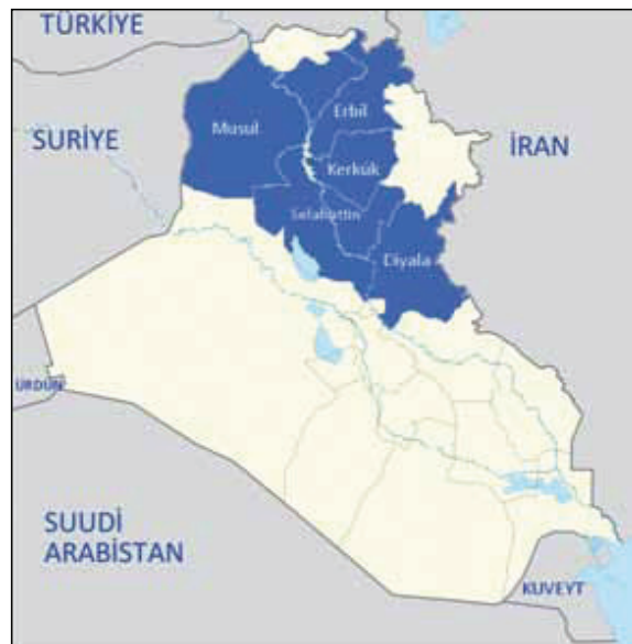
Harita-1: Irak'ta Türkmenlerin Yoğun Olarak Yaşadığı Vilayetler

Irak'ın kurucu unsurlarından biri olarak ifade edilen Türkmenler, Irak'ın en güneyindeki Basra'dan en kuzeyindeki Duhok'a kadar hemen her vilayette yaşamaktadır. Ancak Türkmenlerin yoğun olarak yaşadıkları vilayetler dikkate alındığında, Irak'ın kuzey ve batısından güney doğusuna kadar yaklaşık 50 km'lik genişlikteki bir şeritte yaşadıklarını söylemek mümkündür. Türkmenler başta Kerkük olmak üzere Musul, Erbil, Selahattin ve Diyala vilayetinde yoğun olarak yaşamaktadır.