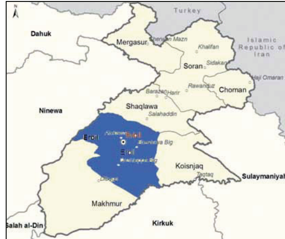
Erbil Vilayeti'nde Türkmenlerin Yoğun Olarak Yaşadığı Yerler

Erbil Vilayeti, Irak'ın kuzeyindeki bölgesel yönetimin sınırları dahilinde olmasına rağmen hatırı sayılır oranda Türkmenlerin yaşadığı bir şehirdir. Türkmenlerin özellikle Erbil şehir merkezinde yaşadığı, 2006 yılına kadar Erbil Kalesindeki 3 mahallede (Tophane, Tekke ve Saray Mahalleleri) yaklaşık 700 evin tamamında Türkmenlerin ikamet ettiği ve 1990'lara kadar Erbil'in şehir merkezindeki en kalabalık nüfusu Türkmenlerin oluşturduğu bilinmektedir. Ancak Saddam Hüseyin'in Irak'ın kuzeyine yönelik yapmış olduğu operasyonların ardından sınır köylerinin vurulmasıyla