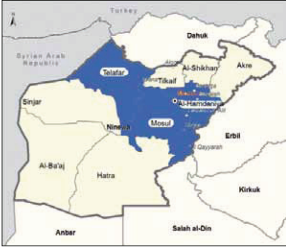
Ninova (Musul) Vilayetinde Türkmenlerin Yoğun Olarak Yaşadığı Yerler

Musul Vilayeti, Musul Merkez İlçe, Telafer, Sincar, Baac, Hamdaniye, Telkeyf, Şeyhan, Hatra ve Akre olmak üzere 9 ilçeden oluşmaktadır. Musul'da Arap çoğunluk olmakla birlikte Türkmenler ve Kürtler de yoğun olarak yaşamaktadır. Diğer taraftan Şebek, Yezidi ve Hıristiyan gibi dinsel azınlıklar da Musul Vilayeti'nde yerleşmiştir. Musul Merkez İlçesi, vilayetin en büyük nüfusunu (yaklaşık 1 milyon 700 bin) barındırırken, Türkmen özelliğine sahip olan Telafer ikinci büyük nüfusu oluşturmaktadır. Telafer'in 2008 Kasım itibarıyla nüfusu 395.150'dir. 4 Musul'da Türkmenler, başta Musul Merkez İlçe ve Telafer olmak üzere, Hamdaniye ve Telkeyf'in güneyinde yoğun olarak yaşamaktadır. Bunun yanı sıra, Musul'un diğer ilçelerinde de Türkmenlerin yaşadığı bilinmektedir. Türkmenler Telkeyf'e bağlı Reşidiye, Şerihan, Karakoyun, Sedabavize, Hamdaniye'ye bağlı Tezharap, Şemsiye, Sellamiye, Karayatak, Sennif, Telafer'e bağlı İyaziye, Muhallebiye, Zammar ve Rabia'da yoğun olarak yaşamaktadır.