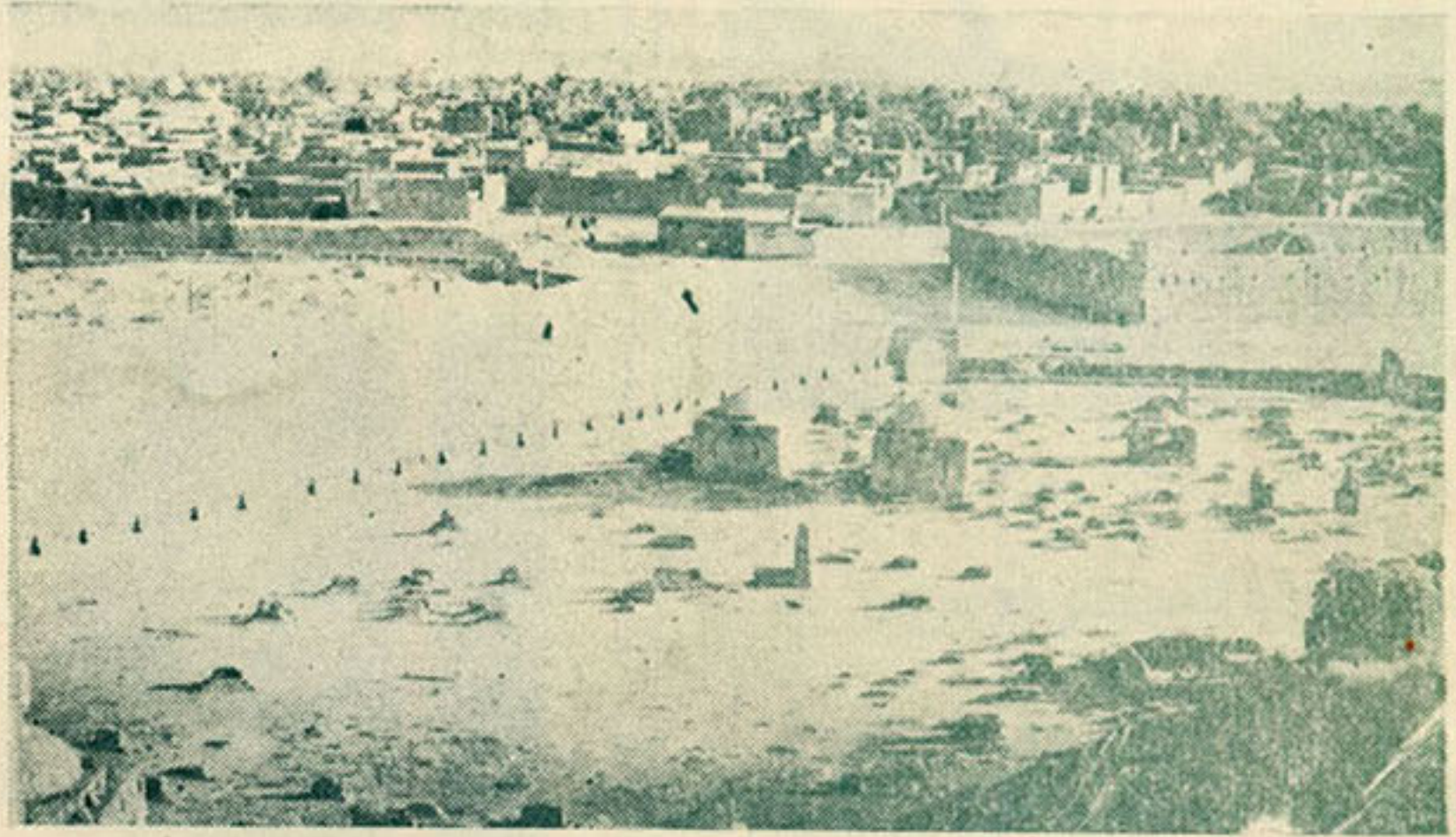
كفرين بر كورونوش